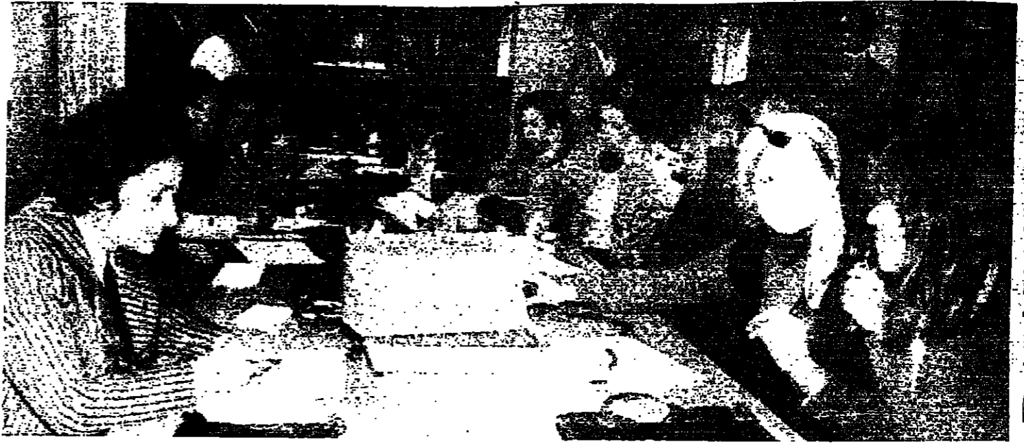
عاملات قسي البريد المركزي